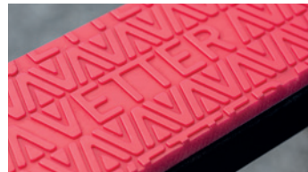
CROC "rojo con dibujo" Poliuretano Grosor 7 mm Mayor resistencia a la abrasión