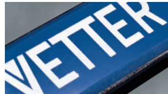
CROC "azul sin dibujo" Poliuretano Grosor 7 mm / certificado por la FDA* (aplicación alimentaria)