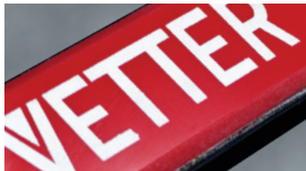
CROC "rojo sin dibujo" Poliuretano Grosor 5 / 10 mm Mayor resistencia a la abrasión