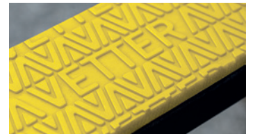
CROC "amarillo con dibujo" Poliuretano Grosor 7 mm Mayor antideslizamiento