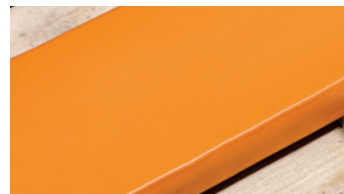
CROC revestimiento de spray para revestimientos completos y superficies geométricas complejas hasta 4 mm de grosor

* Certificación FDA: Certificación aplicación alimentaria (Admon. de Alimentos y Medicamentos EE.UU.)